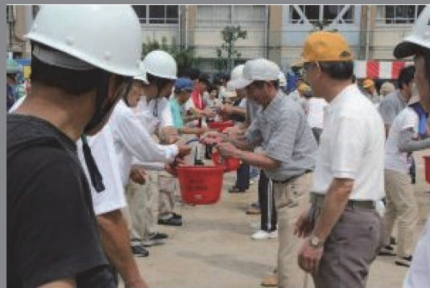
写真：荒川区の震災訓練の様子（左）要介護者の避難を援助する「おんぶ作戦」（右上）D級ポンプによる放水訓練、（右下）バケツリレーによる消火訓練