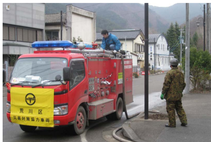
(被災地支援を行う荒川区災害対策協力車両)

荒川区自治総合研究所では、平成23年度に「地域力研究会」を立ち上げ、区の地域力の調査研究を進めています。荒川区には、下町人情に支えられた地域の絆の強さ、先人から受け継いだ区の財産である地域力が今なおしっかりと受け継がれています。そして地域社会を支えてきた町会・自治会の活動を中心に、地域の連携による防犯防災活動や高齢者の見守り、またお祭りなどの伝統文化活動を通じた地域交流などが今日も活発に行われています。