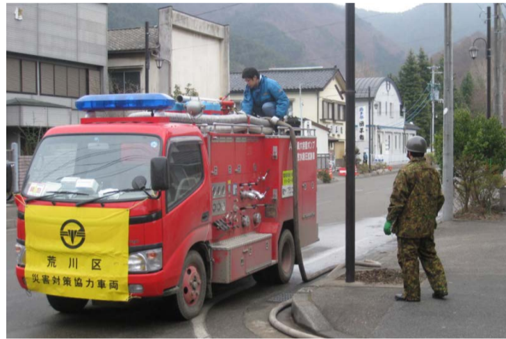
(被災地支援を行う荒川区災害対策協力車両)

荒川区自治総合研究所では、平成23年度に「地域力研究会」を立ち上げ、区の地域力の調査研究を進めています。荒川区には、下町人情に支えられた地域の絆の強さ、先人から受け継いだ区の財産である地域力が今なおしっかりと受け継がれています。そして地域社会を支えてきた町会・自治会の活動を中心に、地域の連携による防犯防災活動や高齢者の見守り、またお祭りなどの伝統文化活動を通じた地域交流などが今日も活発に行われています。